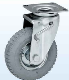
HLETJB2.50-4 PU GRAY