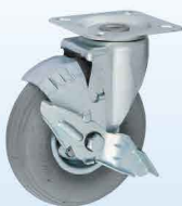
HLJS6 \frac{1}{2} × 2-3 GRAY