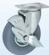
HLJYS6 \frac{1}{2} × 2-3 PU