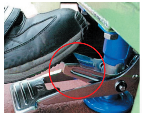
アンロックペダル