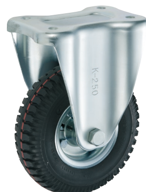
HLK2.50-4 FO BLACK