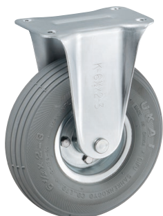
HLK6 \frac{1}{2} ×2-3 GRAY